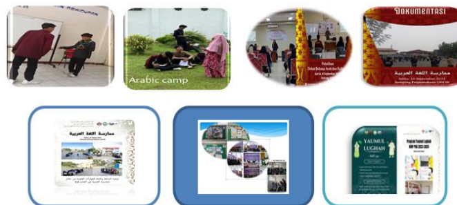
Gambar 3. Dokumentasi Bi'ah Lughawiyah

Lingkungan bahasa Arab informal merupakan lingkungan alami di mana bahasa itu diperoleh langsung akibat interaksi dengan shahibullughah di mana bahasa itu tumbuh dan berkembang (negeri Arab itu sendiri)(Effendy, A.F., 2005). Hasil pengamatan menunjukkan bahwa lingkungan informal diciptakan melalui strategi pelibatan HIMA PBA untuk mengelola kegiatan-kegiatan berupa lingkungan bicara, lingkungan pandang/baca, lingkungan dengar, lingkungan pandangan dengar, kelompok muhibbullaghah , penyelenggaraan pekan bahasa, dan membuat ruang baca /pojok bahasa/kelompok belajar bahasa. Bi'ah thabi'iyah ini lebih bervariasi dibandingkan dengan bia'h ishtina'iyah .